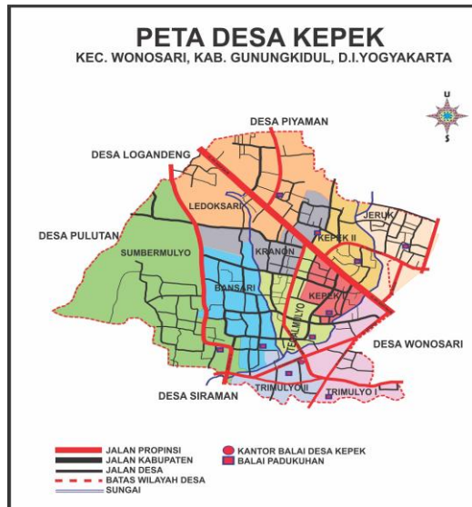
Foto.1. Peta Desa Kepek

Wonten ing sakwetawis papan, batas Desa Kepek kalian Desa sanesipun menika wonten ingkang mboten wonten tengeripun. Ing Padukuhan Trimulyo I wonten salah setunggaling griya warga ingkang ngajeng lumebet wonten tlatah Desa Kepek, ingkang griyo wingking lumebet wonten tlatah Desa Wonosari. Semanten ugi alun-alun Wonosari ingkang mapan wonten ngajeng Kantor Pemerintah Kabupaten Gunungkidul, sakkilenipun wit ringin ingkang ngiring wetan mengaler menika lumebet tlatah Desa Kepek, wondene ingkang sisih wetan mlebet tlatah Desa Wonosari.