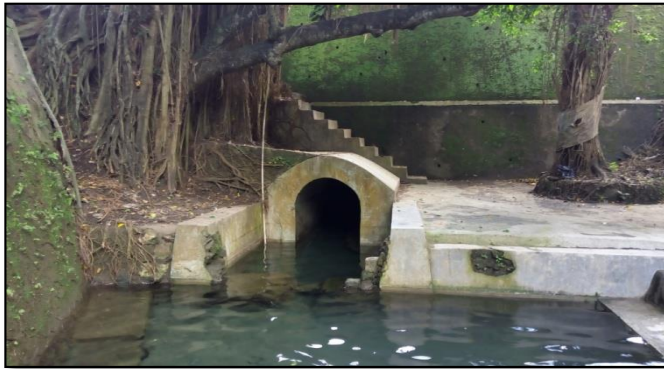
Foto.2. Sumber Belik Pancuran

Kejawi menika Desa Kepek ugi nggadahi potensi sumber mata air bawah tanah Pancuran ingkang mboten nate asat ingkang sakwetawis dipun manfaataken kagem nyekapi kabetahan warga masyarakat sak kiwo tengenipun.